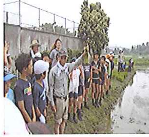
おいしい「チーム米」を目指して