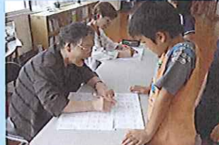
「チャレンジタイム」地域の赤ペン先生から大きな◎をいただきました。