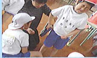
ペア学年で一緒に体力テストに挑戦。1年生を応援する6年生の温かい眼差し