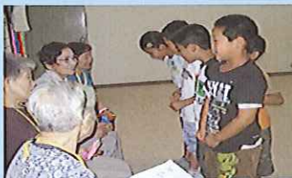
ふれあいスクールのお年寄りとの2回目交流活動。（3年生）