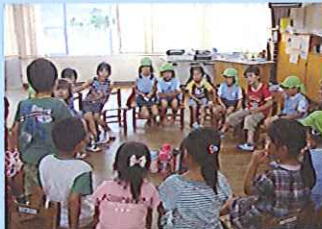
グループ遊びや手作りクイズブックで久原幼稚園児と交流する1年生