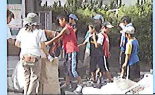
第1回（7月10日）PTA 資源回収で保護者とともに汗を流して働く児童