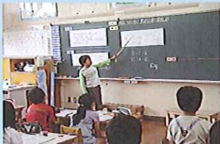
算数。解決の見通しを立て、考えを表現し交流によって練り上げます（4年）