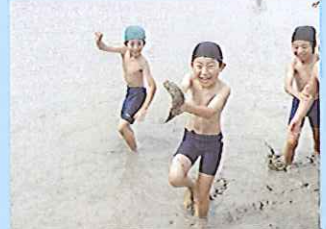
田植え前の田んぼでどろの感触を楽しむ「どろんこ遊び」（2年生）