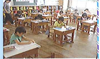
15分間の「はげみタイム」集中して計算の練習に取り組む1年生