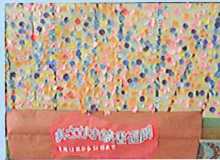
あさがお読書週間で咲いた読書の花。1学期の貸し出し冊数10,706冊。