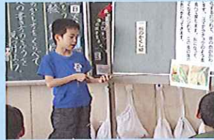
国語。読み取ったことを自分の言葉で豊かに交流します。（3年）