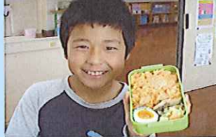
手作り弁当に挑戦し「喜び」「自信」「感謝」を体得しました（道徳の日）