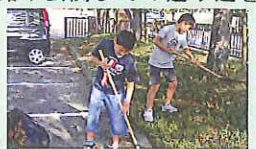
【落ち葉を掃除する6年生】

落ち葉でいっぱいになった校門付近の通学路や玄関までの通り道を6年生が毎朝率先して掃除をしてくれています。その姿は、「久原小の伝統」として他学年の子どもたちの胸にもしっかりと焼き付いているようです。修学旅行のため、6年生が2日間不在にしていたときは、5年生が箒を持って一生懸命に掃き掃除をしてくれました。6年生が学校に戻ってきてからも5年生のボランティアと一緒に朝掃除を行っています。まさに、久原小の伝統を築いている姿です。また、この6年生、5年生の行いは、「伝統は行うことによって築いていくもの」ということを下学年にも伝えてくれています。全学年で久原小の伝統のすばらしさを共有し、守っていけるよう指導致します。