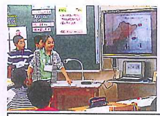
英語で自己紹介をすることを通してコミュニケーションを楽しみます。(6年生)