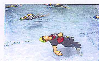
ベイトドル、ビニール袋等を抱え、着衣水泳に取り組みました。命を守る術を学びます。(6年生)