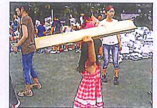
資源回収で保護者とともに汗を流し、働くことの大切さを実感しました。