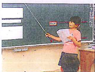
算数。自分の考えを表現し交流によって、さらに練り上げます。(4年生)