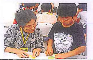
ふれあいスクールで自分のめあてを達成し、達成感を味わいました。(3年生)