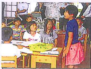
国語。友達目を見て聴き合い語り合いながら読みを深めました。(3年生)