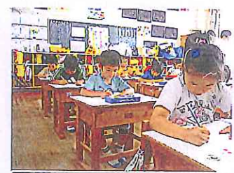
15分間の「はげみタイム」で計算の練習に取り組む1年生。集中力を高めます。