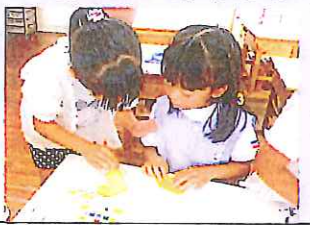
久原幼稚園児と交流する1年生。優しく折り紙を教え、接し方を学びました。