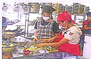
調理実習でサラダを作り、家庭でも生かせる実践力を身に付けます。(5年生)