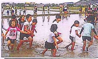
田植え前の「どろんこ遊び」で、心はずませました。(2・5年生)