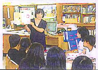
図書館の先生や各学年の子どもたちからの本の紹介で読書の幅を広げます。