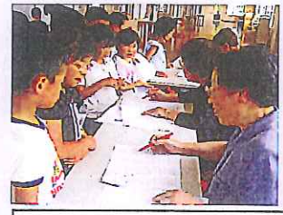
「チャレンジタイム」地域の赤ベン先生からの◎がやる気につながります。