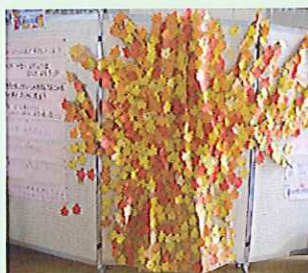
【見事に咲いた読書の木】